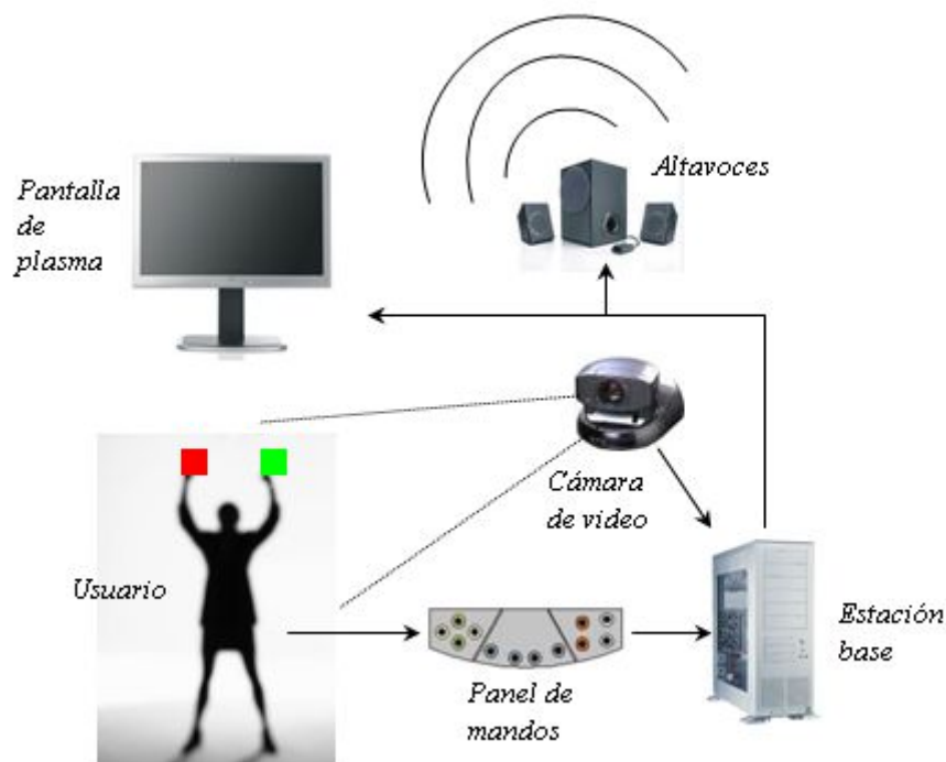
Esquema del sistema Innovæ Music